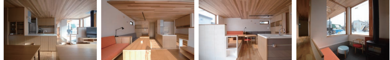
△ダ イング からキッチン方向 △小上がりからダ イング 方向 △キッチンからダ イング 方向 △ダ イング と小上がり ▽キッチンから土間・小上がり方向：低い位置から温め、天井は限りなくフラットに納める

北海道の住まいは、素朴で力強く雪に映える美しい佇まいで、永く愛されるデザインでかつ単純であることがサステナブルと考える。高機能な機械に頼ることのないローテクでシンプルな温熱デザインと、環境に合った住み心地の良いデザインが、北海道の気候・風土に適し、素朴で品のある美しい家が道民の潜在的に求める姿と考える。表1は真冬の1月に薪を焚く前のデータで外気温が氷点下でも、玄関と奥の子供室は20℃以上をキープしている。