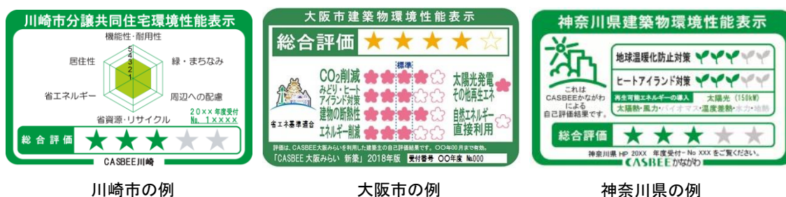
図 2 自治体における環境性能表示制度の例

各自治体では届出制度だけではなく、環境建築物の普及促進を目的として様々なインセンティブ方策を実施している。建築物環境性能表示制度は、CASBEE の評価結果を広告物等に表示することを義務付ける制度であり、大阪市、横浜市など一部の自治体において実施されている。このような表示を行うことで、一般の方への CASBEE の認知を広めるとともに、自主的な環境性能の向上を誘導することを目的として実施されている（図 2）。