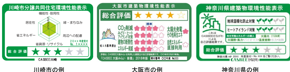
図 2 自治体における環境性能表示制度の例

各自治体では届出制度だけではなく、環境建築物の普及促進を目的として様々なインセンティブ方策を実施している。建築物環境性能表示制度は、CASBEE の評価結果を広告物等に表示することを義務付ける制度であり、大阪市、横浜市など一部の自治体において実施されている。このような表示を行うことで、一般の方への CASBEE の認知を広めるとともに、自主的な環境性能の向上を誘導することを目的として実施されている（図 2）。